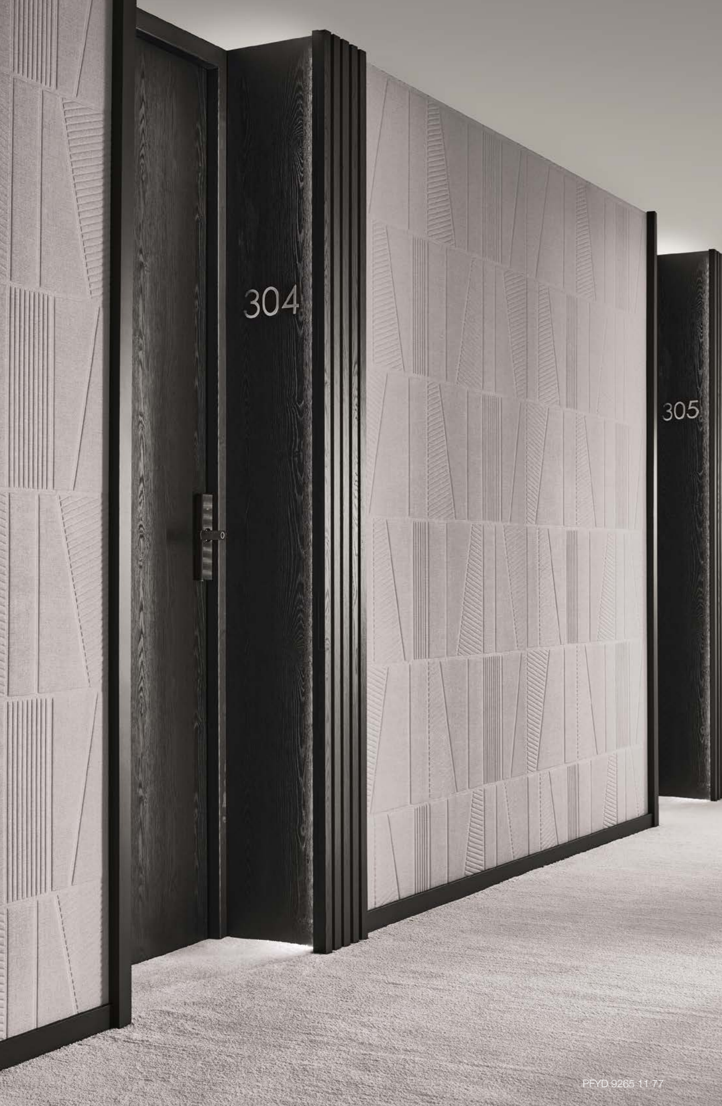
PFYD 9265 11 77