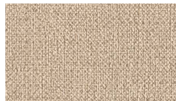
PFYD 9265 02 08