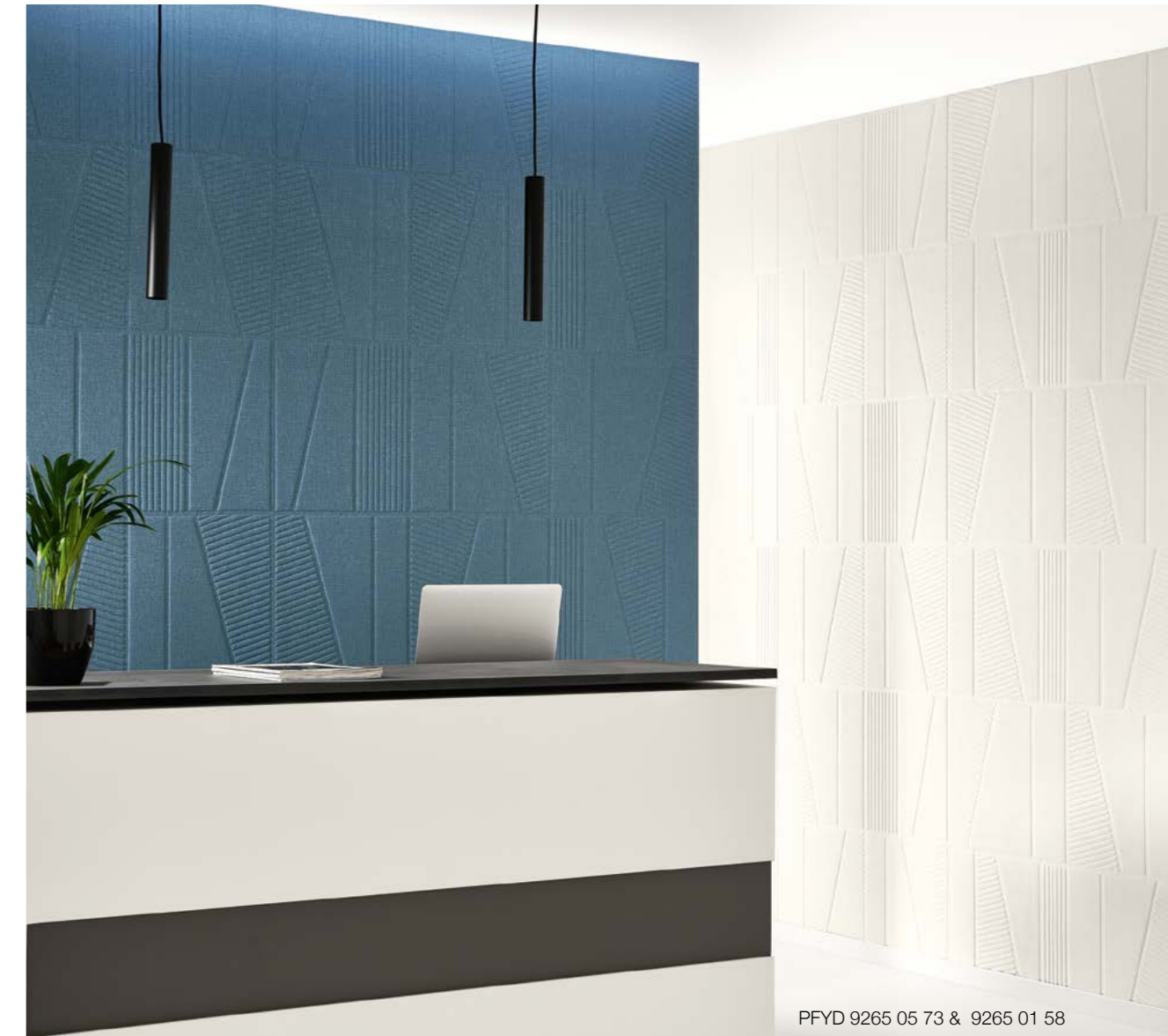
PFYD 9265 05 73 & 9265 01 58