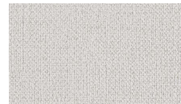
PFYD 9265 02 15