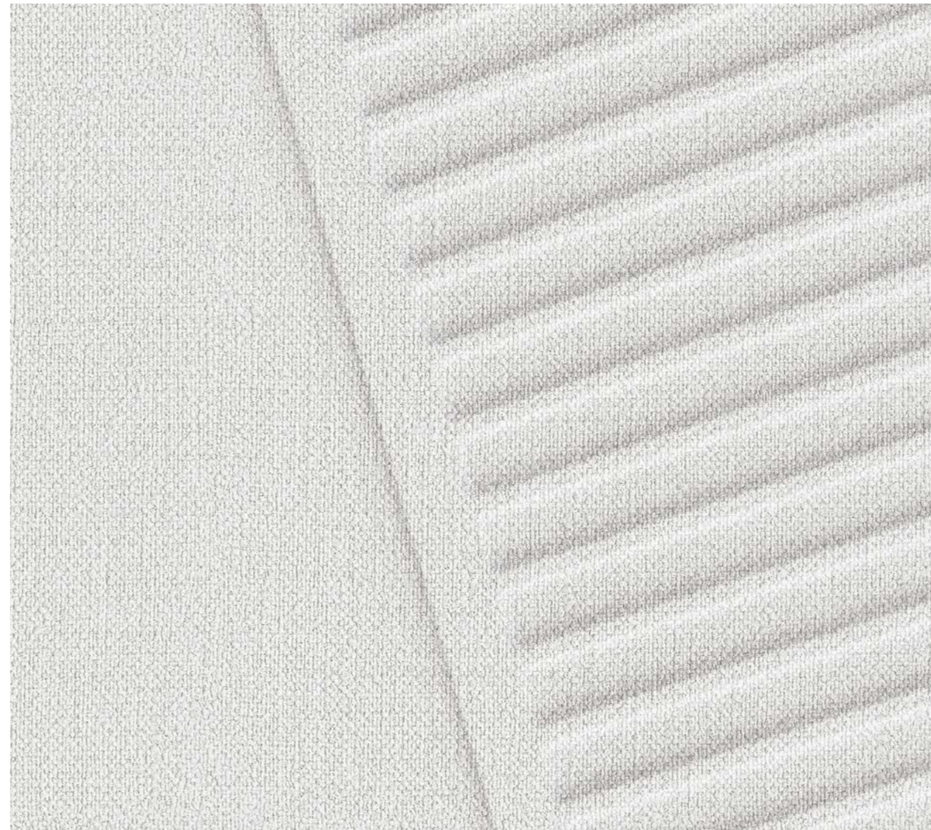
PFYD 9265 01 58