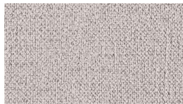
PFYD 9265 11 77