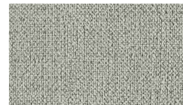
PFYD 9265 04 76