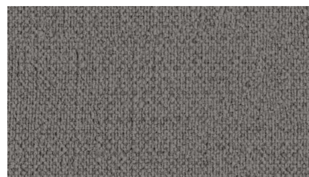
PFYD 9265 11 02