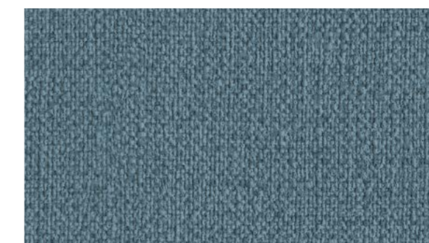
PFYD 9265 05 73