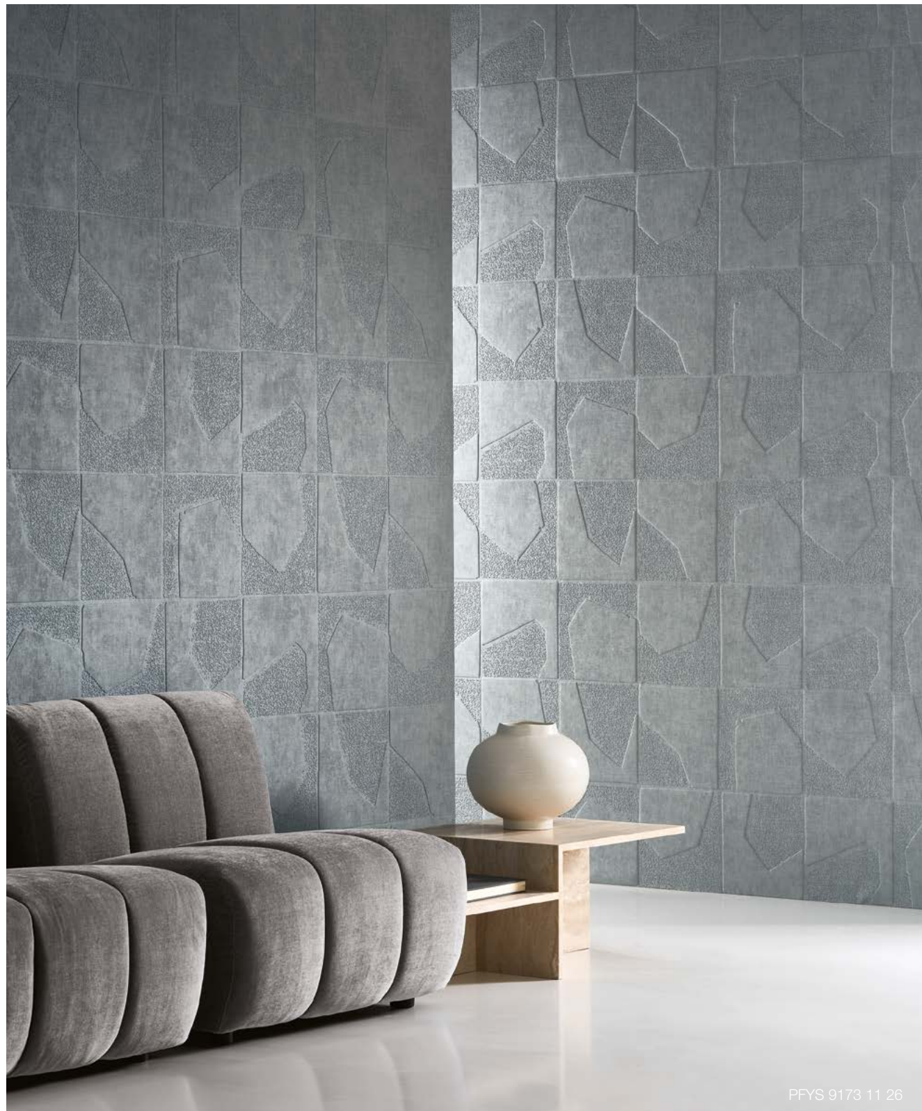
PFYS 9173 11 26