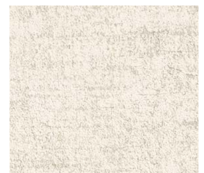
PFYS 9173 02 53