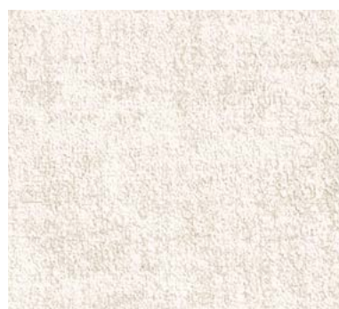
PFYS 9173 01 17