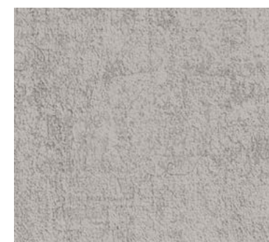
PFYS 9173 11 04